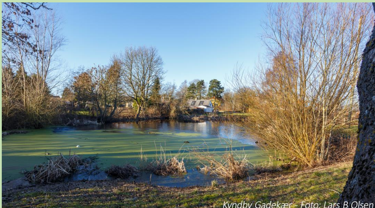
Kyndby Gadekær

Vi fik en grundig gennemgang af affaldssorteringen og problematikker i den forbindelse, og vi fik en rundvisning på værket, hvor vi bl.a. besøgte kontrolrummet med de mange skærme og måleinstrumenter, der til stadighed overvåger processerne.